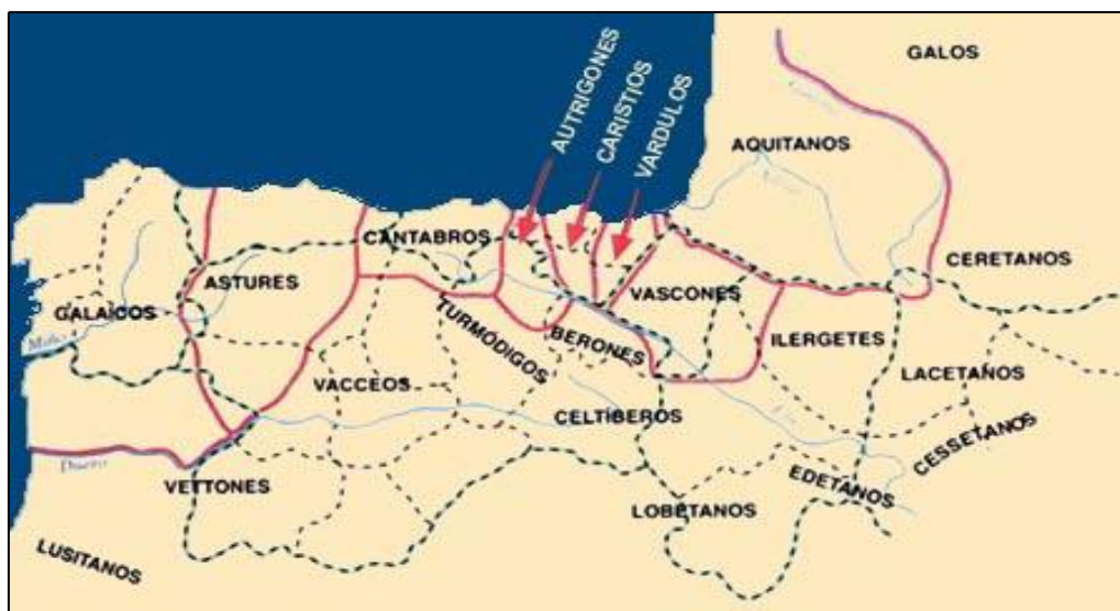
Fig. nº 1. Tribus del Norte de España. Tribus celtas y pueblos indoeuropeos.

Históricamente, el Valle de Valdebezana estuvo situado en el centro geométrico de los territorios dominados por las tribus cántabras, que comprendían los situados en las laderas del Monte Vindio, a los que daba su nombre y que abarcaban la casi totalidad de la actual Cantabria; gran parte del oeste de la provincia de Vizcaya, en la comarca conocida como Las Encartaciones y toda la zona norte de las actuales provincias de Palencia y Burgos hasta más al sur de Oña. Así mismo, se afirmaba que “en las tierras altas del Monte Vindio, tiene su nacimiento el Río Íbero” 3 .