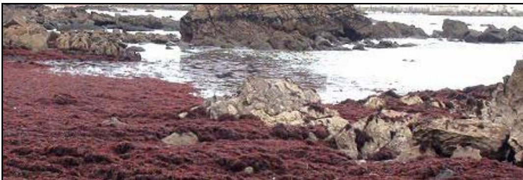
Fig. nº 13. Gelidium sesquipedale (agar-agar). Alga roja.