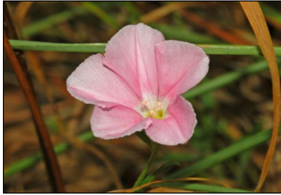
Fig. nº 11. Hierba Cantábrica .