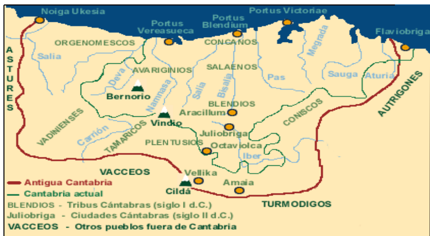
Fig. nº 3. Puertos y ciudades romanos en la antigua Cantabria.

Es el geógrafo griego Estrabón el que más estudia al pueblo cántabro durante las guerras contra César Augusto (*).