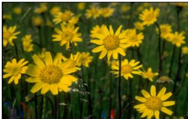
Fig. nº 8. Árnica Montana.