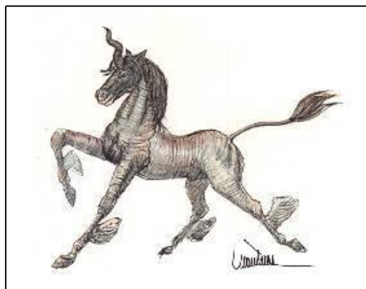
Fig. nº 6. Alicornio.

- Ojancano y su mujer, la Ojancana ; las Anjanas (ser bondadoso por excelencia en Cantabria); las mozas del agua ; los siete Caballucos del Diablo : todos los males de los caballucos del diablo sólo podían ser conjurados mediante la yerbuca de San Juan 15 ; el Culebre ; los Enanucos Bigaristas ; el Hombre-Pez de Liérganes, mito real de Cantabria; las Ijanas del Valle de Aras ; los Nuberos ; la Osa Andara ; La Reina Mora ; la Sirenuca ; el Trasgo ; el Trastolillo ; el Trenti ; los Ventolines y en el Campoo cántabro, el mito del Unicornio, cuya utilidad era la habitual: utilizar las raspaduras del cuerno como medicina ante cualquier enfermedad, denominado aquí como Alicornio .