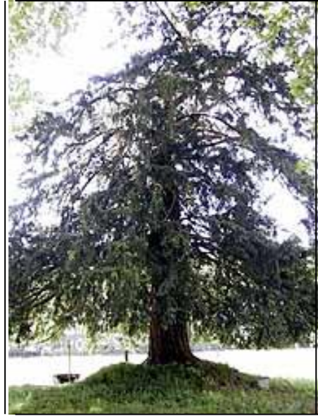
Fig. nº 7. Monumental Tejo.

Perteneciente al Ayuntamiento de Peñarrubia, existe una braña de tejos ( Ver ANEXO. Fig. nº 1, pp. 1147 ). Este lugar conserva, probablemente, uno de los mayores bosques milenarios de tejo que existen en todo el continente europeo. En la actualidad, el primer sábado de agosto, se celebra una subida popular desde Cicera, que culmina con una comida campestre y bailes regionales, habiéndose declarado de Interés Regional en 2004 21 . Anualmente, se confiere en Cantabria, el premio Tejo Cántabro que representa una anjana bajo el mítico tejo ( Ver ANEXO. Fig. nº 2, pp. 1148 ) 22 .