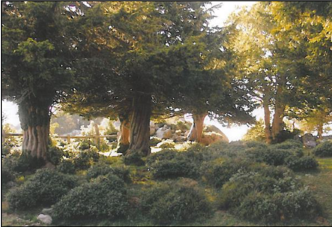
Fig. nº 12. Braña de los TEJOS. Peñarrubia. (Ver ANEXO. Fig. nº 1, pp. 1147).