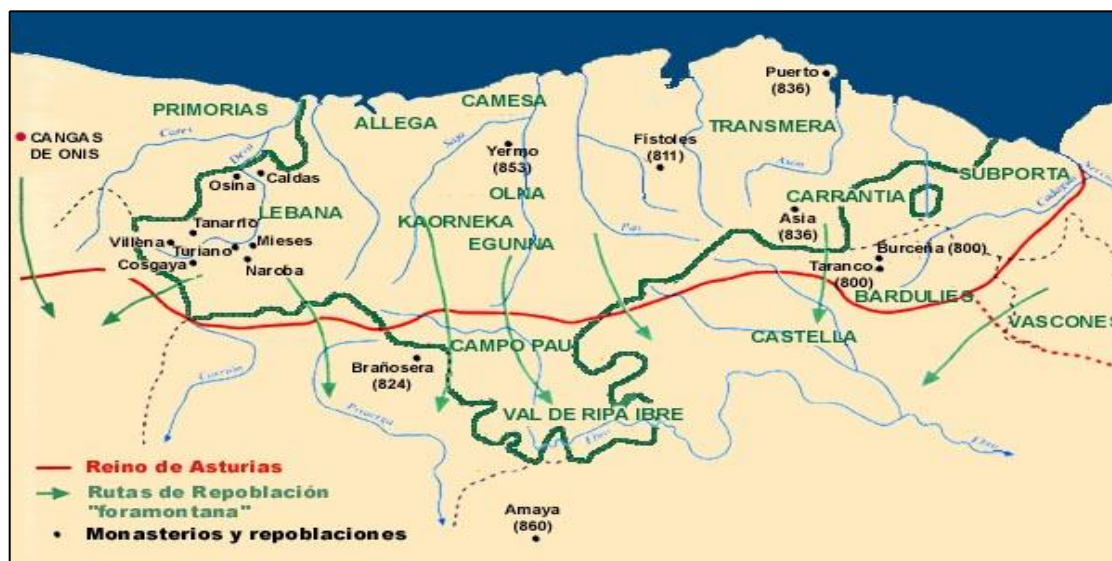
Fig. nº 4. Rutas de Repoblación Foramontana .

Foramontanos, pues, eran los cántabros que desde la Malacoria, hoy Mazcuerras, siguieron este itinerario fuera de las montañas, con objeto de repoblar Castilla en el primer siglo de la Reconquista.