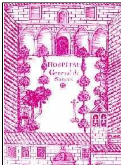
Fig. nº 66. Hospital de S. Juan Bautista del Monasterio de Guadalupe, donde se realizó la primera disección anatómica en España. Año de 1402.

El sagrado Concilio de Constanza , de 6 de julio de 1415 , celebrado en Alemania, prohibía maquinar la muerte de los príncipes aún cuando fuesen tiranos. La religión cristiana estaba pues el amparo de los reyes . Aunque el Estado trató de organizar la asistencia sanitaria al margen del modelo eclesiástico, fue la Iglesia la que continuaba fundando Órdenes Religiosas y modificando otras ya existentes para que se dedicaran especialmente a la atención sanitaria en los hospitales y fuera de ellos.