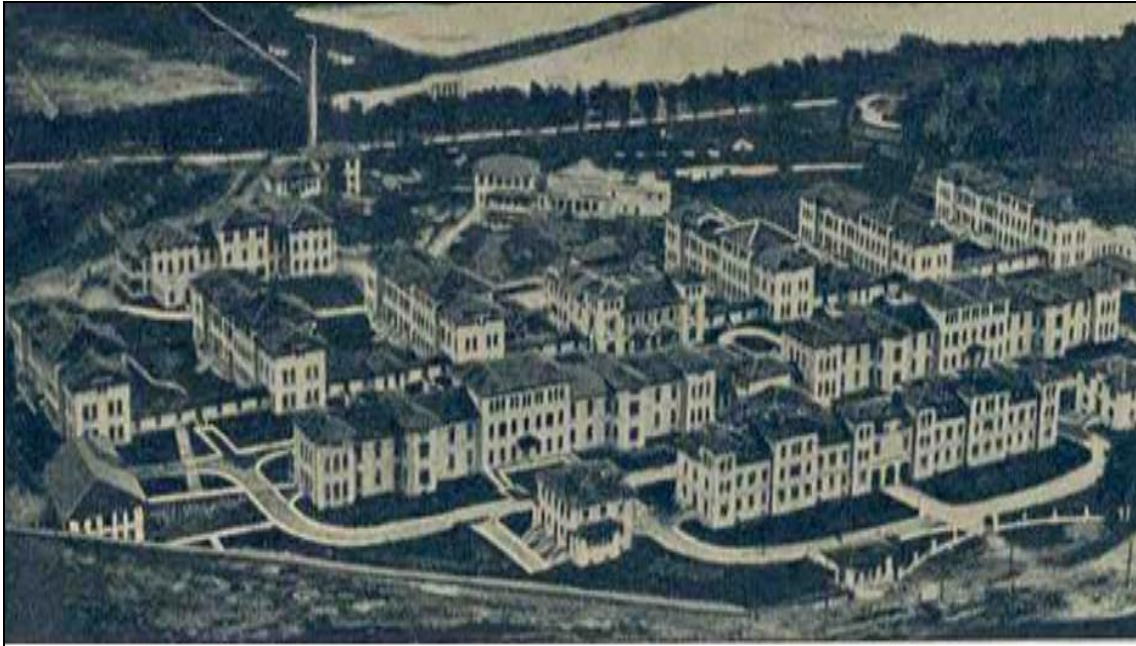
Fig. nº 109. Evolución del Complejo de la Casa de Salud de Valdecilla. Grabado de Manuel Lledías, en 1950.