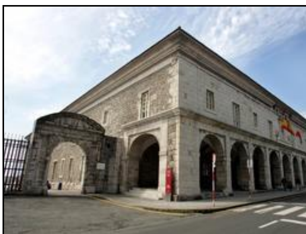
Fig. nº 112. Antigo Hospital de San Rafael. Actual sede del Parlamento de Cantabria.

De todos estos utensilios usados en el siglo XIX y perteneciente a la botica del Hospital de San Rafael se conservan solamente: una balanza tradicional con dos platillos y una placa o molde para hacer óvulos y supositorios 25 .