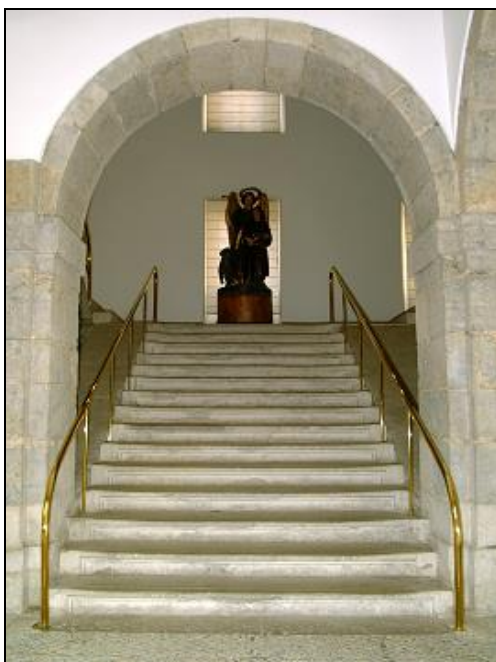
Fig. nº 104. Escalera principal con talla del Arcángel San Rafael.

El Hospital fue de una construcción espléndida, funcional para su época y “ buscando aire puro ”, situado en la parte alta de la Ciudad, al final de la calle y frente al Convento donde estaban las monjas de la Santa Cruz del Monte Calvario, de la Orden de San Francisco. Se asistían en él, un día con otro, 100 enfermos, habiendo acomodo para más de 200. El número de estancias anuales era de 24 por término medio 105 .